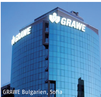
GRAWE Bulgarien, Sofia

GRAWE nekretnine d.o.o. Beograd GRAWE nekretnine d.o.o. Sarajevo GRAWE nekretnine d.o.o. Banja Luka GRAWE Nedviznosti dooel Skopje GRAWE Imoti dooel Skopje GRAWE Imoti EOOD Sofia GRAWE Facility Management SRL BAYOU Kft.