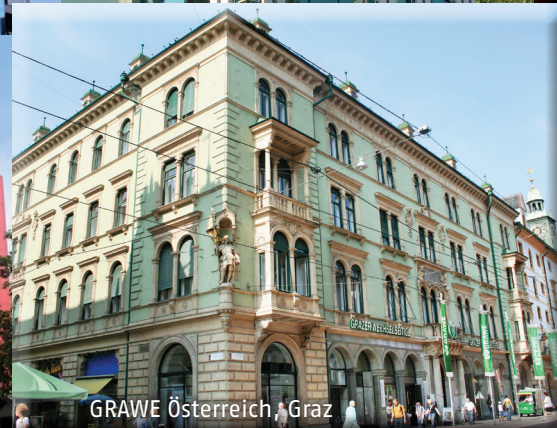
GRAWE Österreich, Graz