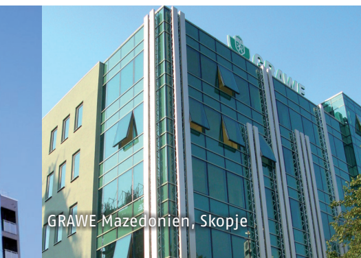
GRAWE Mazedonien, Skopje