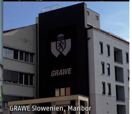
GRAWE Slowenien, Maribor