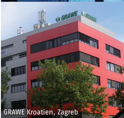
GRAWE Kroatien, Zagreb